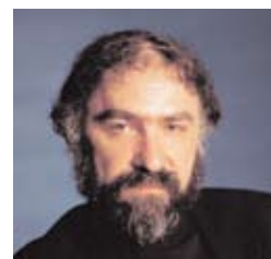
Radu Lupu