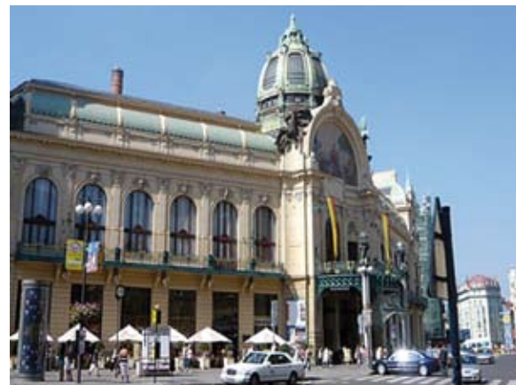
La façade de la Salle Smetana à Prague