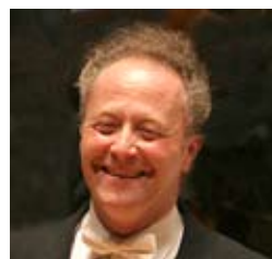
Emmanuel Krivine

La direction de tous ces concerts sera assurée par notre Directeur musical, Emmanuel Krivine, par un des plus intéressants chefs américains actuels, Hugh Wolff, qui avait triomphé avec l'OPL en novembre 2008, et deux chefs russes de générations différentes: Vassili Sinaïsky, actuellement chef titulaire de l'Orchestre Symphonique de Malmö, ancien Premier Lauréat du Concours Karajan, ainsi que le jeune