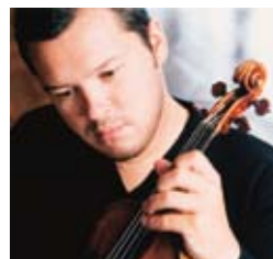
Vadim Repin