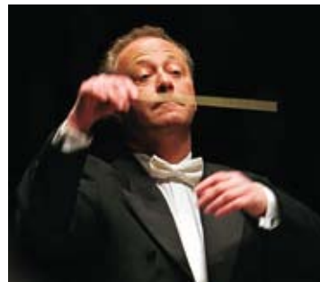
Emmanuel Krivine commence l'intégrale des œuvres pour orchestre de Claude Debussy