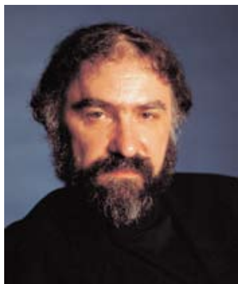
Radu Lupu

Le 6 janvier à 19:00, le deuxième concert du nouveau cycle 'Dating:' aura lieu à la Philharmonie. Il tournera autour de Brahms et de la 3 e symphonie. Avec sa Troisième symphonie, innervée par une formidable pulsation, Brahms avait enthousiasmé le public berlinois. En revanche, la création de son Premier Concerto pour piano et orchestre à Leipzig avait été un désastre total. Aujourd'hui, cette œuvre sombre, écrite sous l'impression de la maladie incurable de Schumann, est l'un des concertos les plus célèbres du genre. Comme la 3 e symphonie, cette composition figure au programme des deux concerts du 7 et 8 janvier à 20:00 à la Philharmonie. Vous y aurez l'occasion de découvrir ou redécouvrir un pianiste exceptionnel, le déjà légendaire Radu Lupu. Ses interprétations singulières et sensibles font en sorte qu'il est reconnu comme étant l'un des derniers géants du piano au 20 e siècle. Les trois concerts seront placés sous la direction d'Emmanuel Krivine.