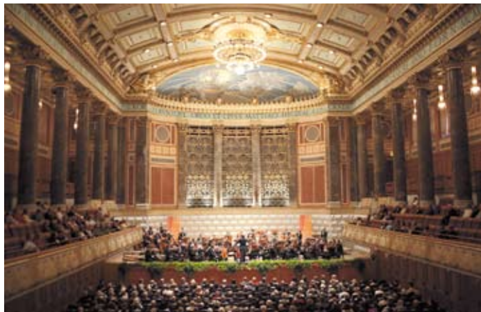
L'OPL lors du concert des 'Burghofspiele' à Wiesbaden