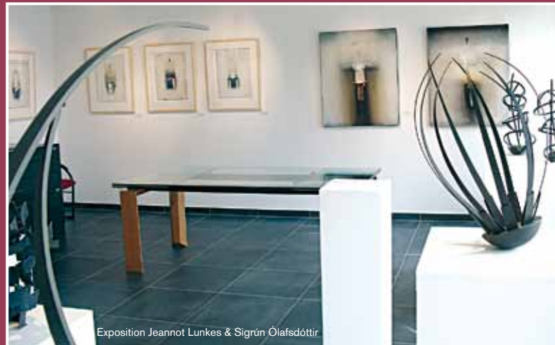
Exposition Jeannot Lunkes & Sigrún Ólafsdóttir

Un lieu de rencontre, un forum de dialogue culturel conçu pour des expositions, lectures et tables rondes