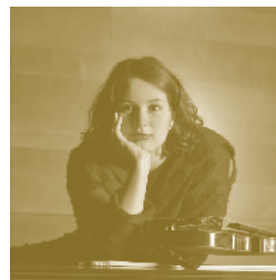
Patricia Kopatchinskaja

Depuis, le 'New Talent - SPP Award' de l'Union Européenne de Radio-diffusion (UER) et, en 2006, le 'Förderpreis Deutschlandfunk' ont salué